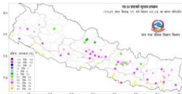
नक्सा २: वैशाख २८ गते बिहान ०८:४५ बजे देखि वैशाख २९ गते बिहान ०८:४५ बजे सम्मको २४ घण्टाको न्यूनतम तापक्रम (डिग्री सेल्सियस)