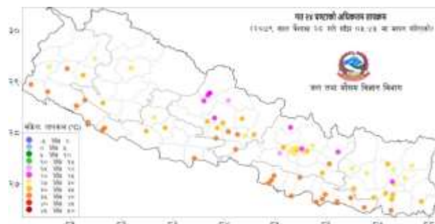
नक्सा ३: वैशाख २७ गते साँझ ०५:४५ बजे देखि वैशाख २८ गते साँझ ०५:४५ बजे सम्मको २४ घण्टाको अधिकतम तापक्रम (डिग्री सेल्सियस)

तालिका १: २०७९/०१/२९ गते बिहान ०८:४५ बजे मापन गरिएको गत २४ घण्टाको न्यूनतम तापक्रम र २०७९/०१/२८ गते साँझ ०५:४५ बजे मापन गरिएको गत २४ घण्टाको अधिकतम तापक्रमको विवरण।