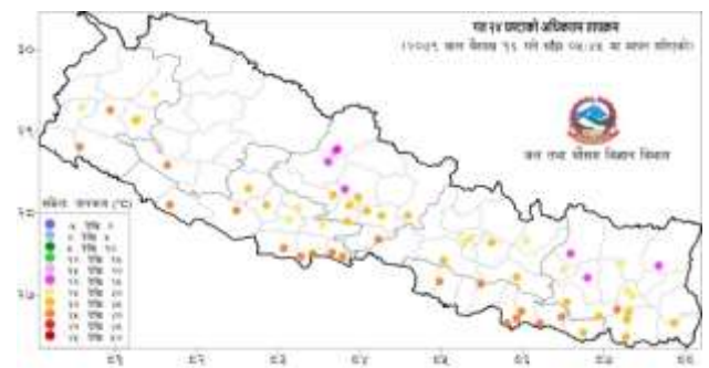
नक्सा ३: वैशाख १६गते साँझ ०५:४५ बजे देखि वैशाख १६गते साँझ ०५:४५ बजे सम्मको २४ घण्टाको अधिकतम तापक्रम (डिग्री सेल्सियस)