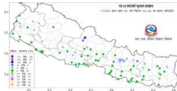
नक्सा २: माघ १७ गते बिहान ०८:४५ बजे देखि माघ १८ गते बिहान ०८:४५ बजे सम्मको २४ घण्टाको न्यूनतम तापक्रम (डिग्री सेल्सियस)