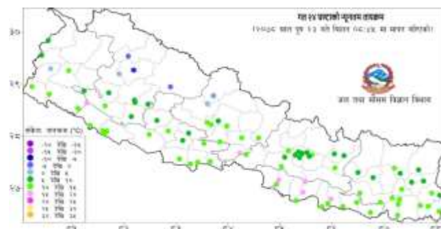
नक्सा २: पुष २२ गते बिहान ०८:४५ बजे देखि पुष २३ गते बिहान ०८:४५ बजे सम्मको २४ घण्टाको न्यूनतम तापक्रम (डिग्री सेल्सियस)